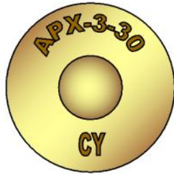
Atelier de Construction de Puteaux brass supplier Crozet-Fourneyron.

The .303 cartridge has been used by the French military system since WWI when they used the calibre in Vickers and Lewis aircraft machine guns. During WWII they used both the .303 rifle and Bren LMG. Use of these weapons and ammunition continued into the early 60's in Indo-China and Algeria and, I presume anywhere else the French were fighting their colonial rebellions.