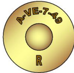
Cartoucherie de Valence brass supplier Usine de Rugles