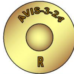
Atelier de Fabrication de Vincennes brass supplier Usine de Rugles.