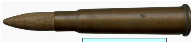
Wood bulleted blank.