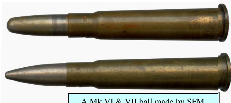
A Mk VI & VII ball made by SFM.