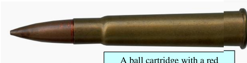
A ball cartridge with a red mouth seal?